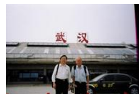
照片 4 武漢