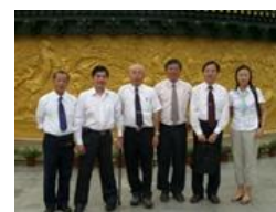
照片 7 長春大學