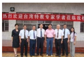
照片 11 長沙盲聾校