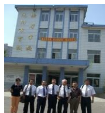
照片 6 瀋陽盲校