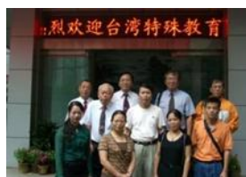
照片 9 太原盲校