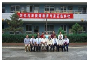
照片 13 南昌盲校