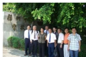
照片 10 福州盲校