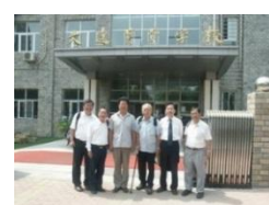
照片 5 大連盲聾校