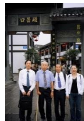
照片 3 重慶瓷器口