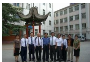
照片 8 蘭州盲聾校