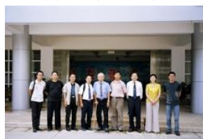
照片 12 合肥特教中心