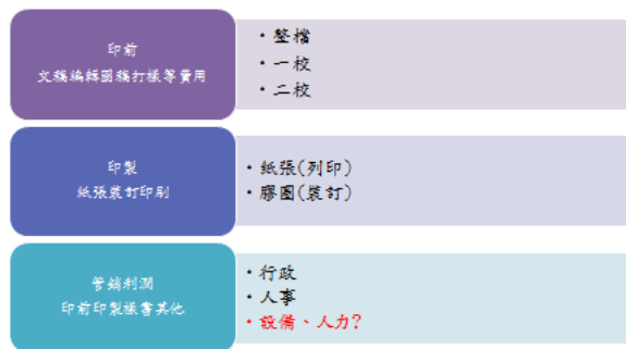
圖 5 教科書的計價方式