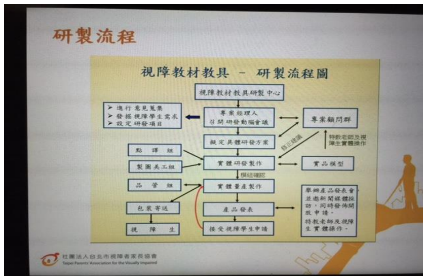
圖 2 台北市視障者家長協會教材教具製作流程

劉佑星(2016)指出目前大字體、點字及有聲教科書等業務由「教育部國民及學前教育署」主辦並編列經費，近年來分別由淡江大學盲生資源中心、光鹽愛盲協會、愛盲基金會、臺北市視障者家長協會、無障礙科技發展協會、二所啟明學校、伊甸社會福利基金會、臺南大學視障教育與重建中心等單位標購製作。